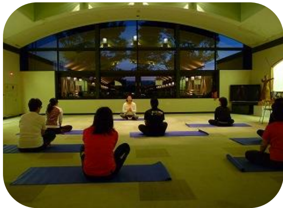
ストレッチをしながら先生の説を聞きます♪