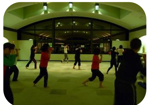
しっかり骨盤を回して パンチ！！