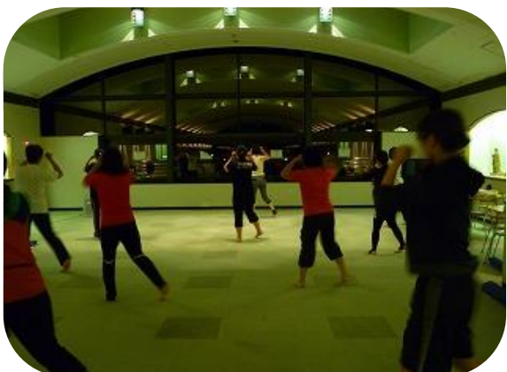
ムエタイの基本形を教えてください♪