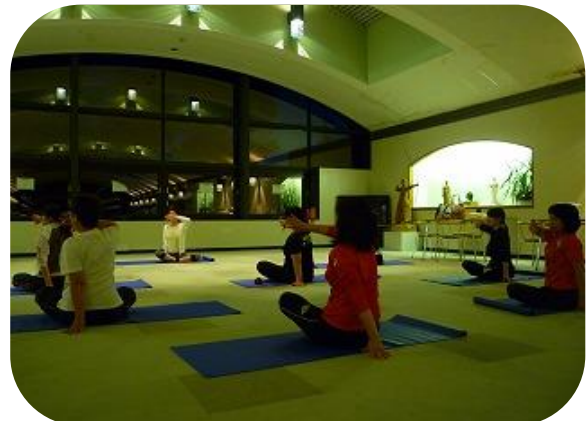
みなさん、体がほぐれてきましたか？(*_*)